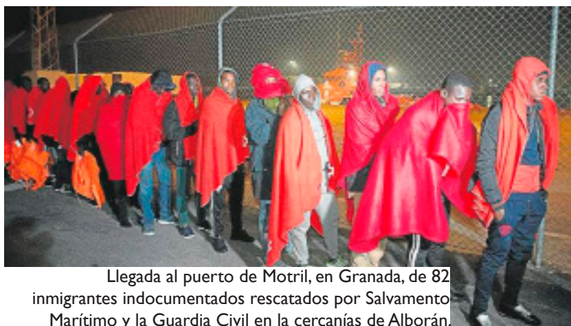
Llegada al puerto de Motril, en Granada, de 82 inmigrantes indocumentados rescatados por Salvamento Marítimo y la Guardia Civil en la cercanías de Alborán.

“ M ADRID / EFE – La llegada de inmigrantes a España por mar en enero de este año se ha incrementado en un 194% respecto al mismo período de 2018 y ya son 4.104 las personas que han llegado en 98 embarcaciones por las costas peninsulares y de Baleares, Canarias, Ceuta y Melilla, según el último informe del Ministerio del Interior.