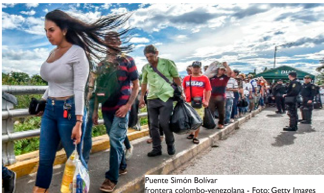
Puente Simón Bolívar frontera colombo-venezolana

El retorno de las víctimas del conflicto interno en Colombia también es una de las realidades de la diáspora venezolana. Las largas décadas de conflicto han sido uno de los detonantes de la salida de millones de colombianos hacia varios destinos en el exterior, entre ellos Venezuela, con quien compartimos una porosa frontera que, más allá de ser una extensa línea de división territorial, ha significado para los nacionales de ambos países la posibilidad de acceder a una mejor vida en ciertos momentos de crisis internas.